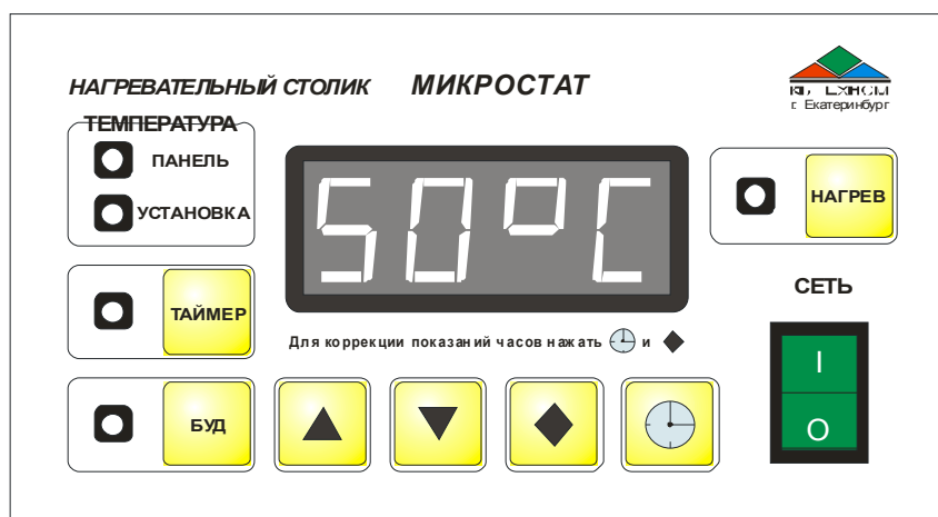
Рис.1 Панель управления столиком

Столик имеет горизонтально расположенную нагревательную панель прямоугольной формы, укрепленную на корпусе. На лицевой панели столика расположены органы управления и индикации (рис. 1), на задней стенке корпуса находятся держатель предохранителя и шнур сетевого питания. На дне корпуса имеется люк для смены литиевой батареи.